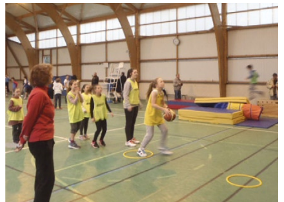
Basket, gymnastique, frisbee, hockey ou encore saut en longueur et d'obstacles étaient les disciplines au menu.