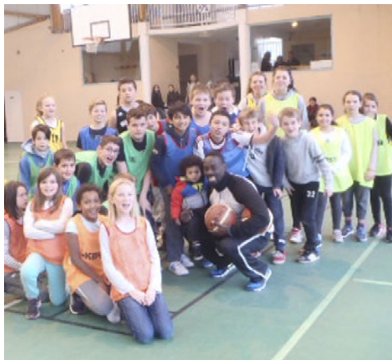
Les premières Olympiades de la jeunesse ont eu lieu dimanche. Une trentaine de jeunes étaient présents.